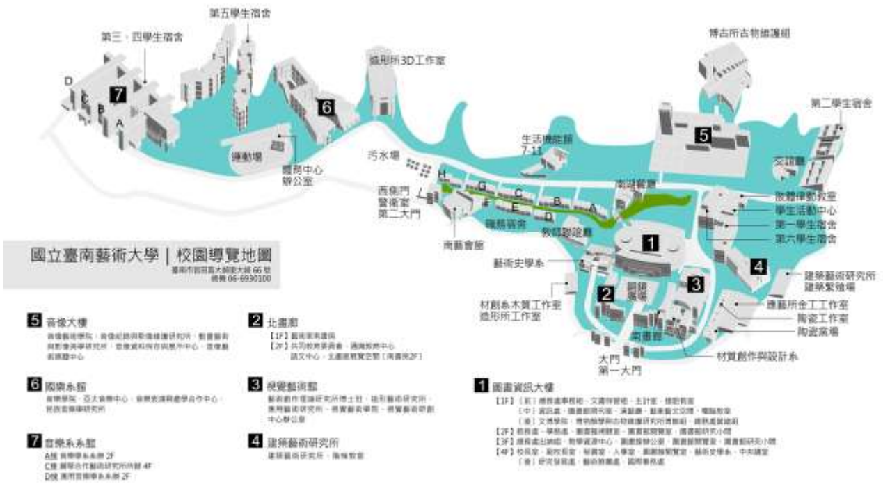
圖一 南藝大校內地圖