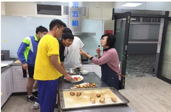
教師耐心提醒油醋沙拉的蔬菜切丁大小