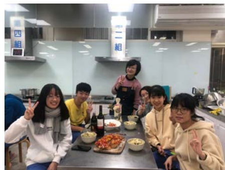
完整體驗 滿足的小組合照