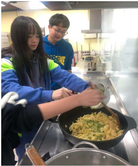
把麵、餡料、青醬小火拌勻、避免高溫破壞油品