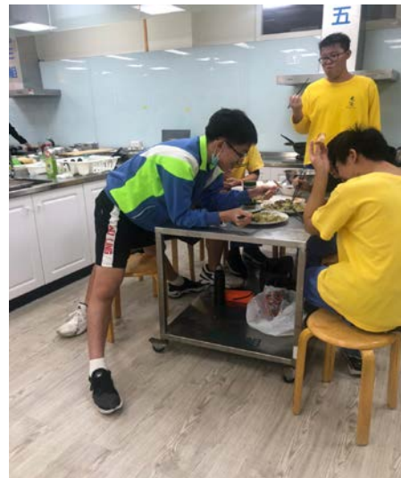
認真地品嚐感受中