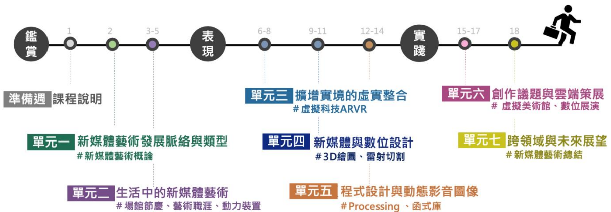
新媒體藝術線上課程單元進程圖