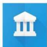
google art& culture